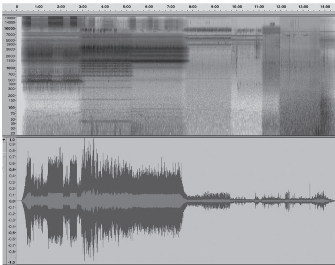
Figura 1 / Espectrograma (superior) y forma de onda (inferior) de un extracto de la obra La selva , del artista sonoro Francisco López (imágenes generadas por el autor).

La Figura 1 muestra un espectrograma y forma de onda de un extracto de la composición, donde se puede apreciar la evolución timbrística y dinámica de la obra.